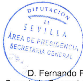
D. Fernando Fernández - Figueroa Guerrero. Secretario General de la Diputación Provincial de Sevilla.